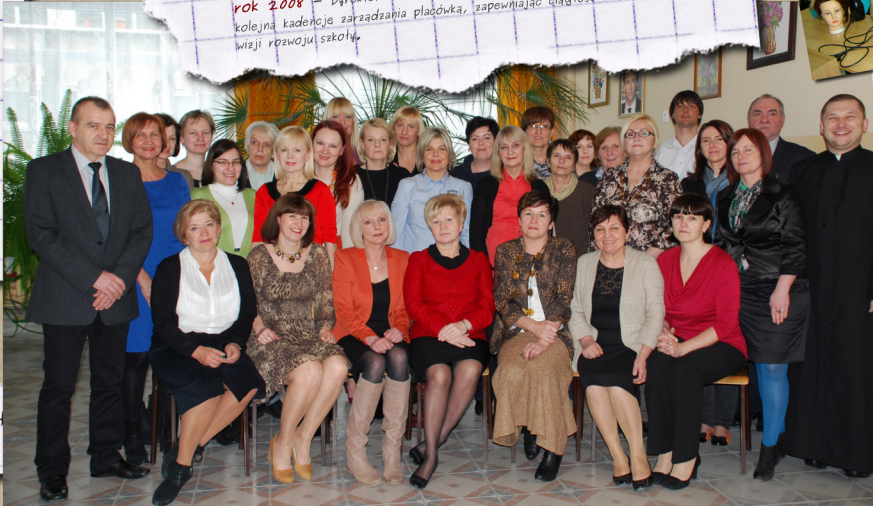
Pracownicy naszej szkoły

rok 2009 – Nauczyciele stają przed wyzwaniem kształcenia w roku indywidualnym. Sukces edukacyjny odnosi 11 absolwentów. rok 2010 – Szkoła otwiera swoje podwoje dla uczennic Technikum Zawodowego nr 2 w zawodzie technik usług fryzjerskich. rok 2011 – Zostaje nawiązana współpraca z Zespołem Szkół nr 1 w Bydgoszczy specjalizującym się w kształceniu fryzjerów. rok 2013 – W Trójce o podtrzymanie tradycji i ceremonialną szkoły następuje odnowa sztandar Zespołu Szkół nr 8.